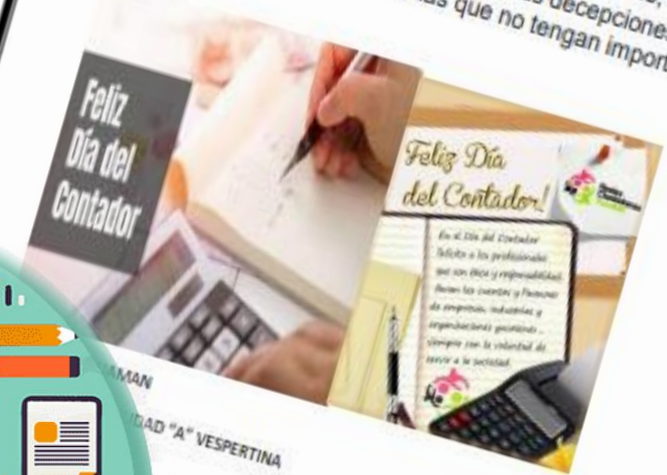
MAN IDAD "A" VESPERTINA

En otros países se celebran en diferentes fechas como por ejemplo en México se celebra el 25 de mayo "Un contador es capaz de sumar las satisfacciones, multiplicarlas por los sueños, restarle las decepciones y dividir para tu vida"